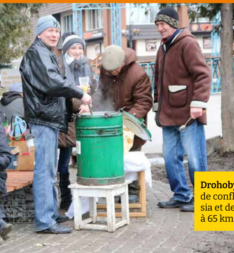
distribution de soupe dans la rue.

Nasha Khata accueille des personnes fuyant les conflits à l'Est. La soixantaine de compagnons de la communauté organise des distributions de vêtements et de nourriture, de plats chauds. Ils veillent aussi sur les personnes âgées des alentours. Toutes les activités de la communauté sont à l'arrêt, comme à Emmaüs Oselya. Ils n'ont plus aucun revenu et reçoivent le soutien du Mouvement Emmaüs pour poursuivre leurs actions.