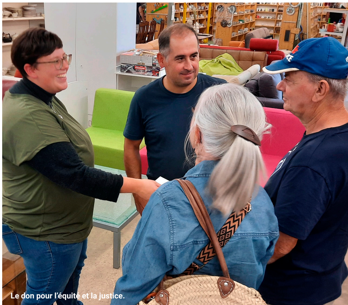
Le don pour l'équité et la justice.