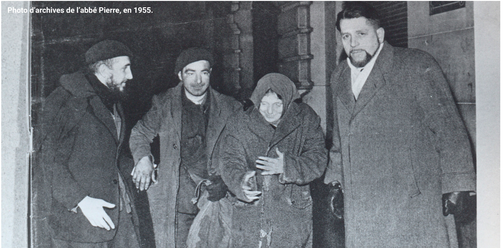
Photo d'archives de l'abbé Pierre, en 1955.